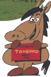
とねっこくん（日高町）