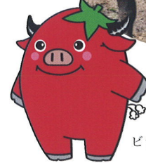
ビラッキー（平取町）