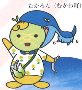
むかろん（むかわ町）