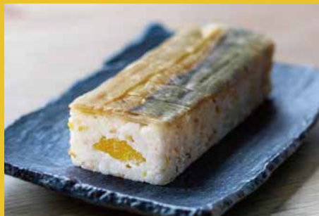
ニシンバッテラ (石狩市)