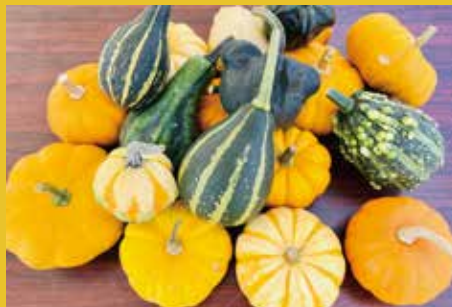
ハロウィンカボチャ (当別町)