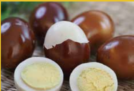
お土産燻製たまご (北広島市)