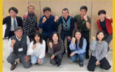
地域おこし協力隊