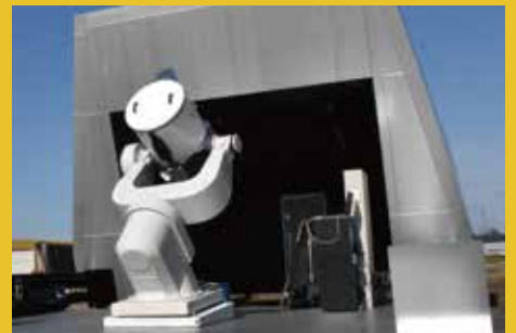
しんしのつ天文台 (新篠津村)